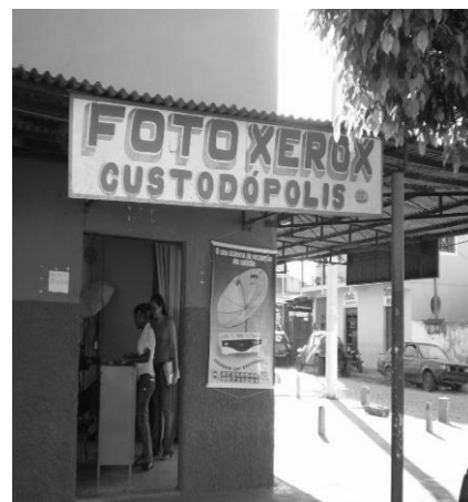
Figura 2: Serviços de fotocópias.