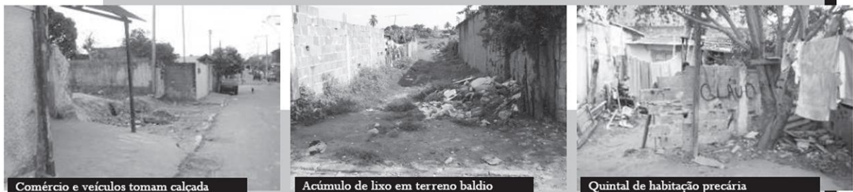
Comércio e veículos tomam calçada