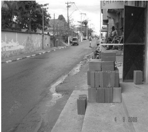
Figura 13: Esgoto nas ruas.

lado, culpam o descaso do poder público, por outro, sabem que os próprios moradores também contribuem para o agravamento de tais condições.