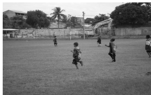
Figura 10: Escolinha de Futebol.