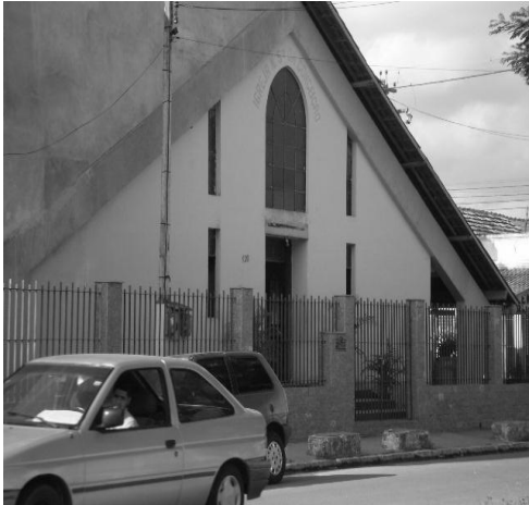
Figura 5: Igreja Católica.

Batista é, para os moradores, um exemplo por sua prática de “ distribuição de alimentos, remédios, passagens e pequenas reformas nas casas dos mais carentes ” (GRIPES, 2008, p.47).