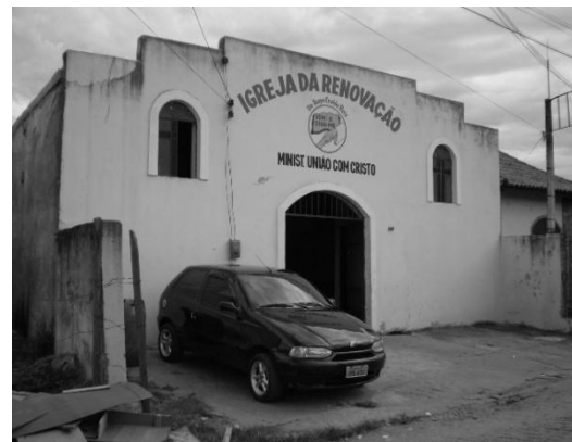
Figura 8: Igreja da Renovação.