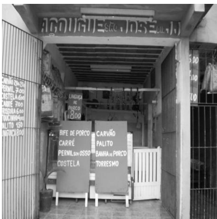
Figura 1: Açougue.

É no entorno da Praça José Dias Nogueira, numa mistura de atividades de comércio e serviços, que Custodópolis se desenha. Tem “supermercado, farmácias, açougues, bares, sorveterias, Lan Hause , hortifruti, depósito de bebidas, loja de fotos, roupas, brinquedos, artigos para o lar, material elétrico e ferragens, locadora de DVDs, posto de combustível, consultório odontológico, brechó de roupas usadas, sapateiro” (GRIPES, 2008, p.37).