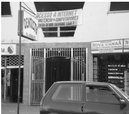
Figura 3: Galeria de lojas.