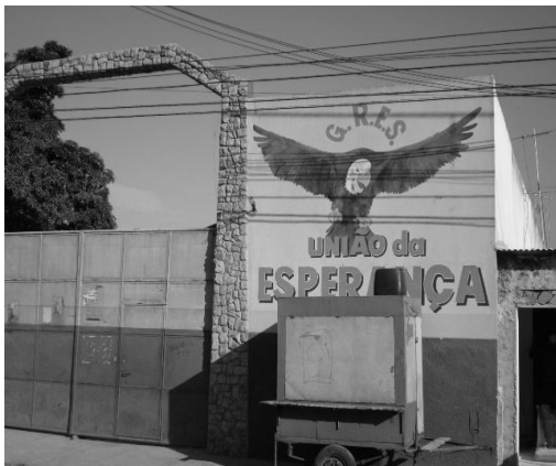
Figura 11: Sede da Escola de Samba.

Todo domingo tem pagode na quadra do União da Esperança, mas na narrativa de alguns moradores “o ambiente não é recomendado para os que gostam de respeito” (GRIPES, 2008, p.41). A praça, que na opinião dos mais antigos era um bom local de “convivência e entretenimento”, tornou-se um lugar ocupado pela “molecada” e, depois de recente reforma, os quiosques a transformaram em ponto de encontro “dos que vivem para beber”, “nem mesmo para as crianças o espaço é destinado”. À noite ela é motivo de preocupação, devido à falta de segurança do bairro, e a ausência de policiamento — apesar da existência de uma delegacia de polícia civil que, na opinião dos moradores, não é sinal de proteção. Houve relato de que “mataram gente em frente a delegacia” ( Ibid ,p.51). Provas de incivilidade são também os “pegas de motos”, que acontecem aos sábados, na avenida principal do bairro. Motivo de preocupação para muitos moradores, os bailes funk , que acontecem no Club di Roma , atraem jovens de outras localidades, tornando a comunidade mais vulnerável com a presença desses OUTROS.