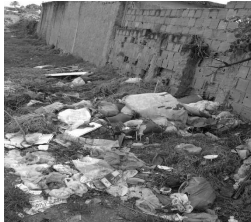
Figura 14: Lixo em terreno baldio.

Insegura e desprotegida é a vida desses moradores. São homens que enfrentam a realidade do desemprego ou de ocupações informais, de pouca remuneração, e mulheres, em sua maioria, que se dedicam a atividades domésticas, seja em suas casas, ou na casa dos “outros”. O fato é que a pobreza sempre existiu, tanto no passado quanto no presente, porque Custodópolis é terra de “um povo sacrificado, sofrido” (GRIPES, 2008, p.10). E isso é possível de ser identificado nas habitações precárias, no baixo nível de escolaridade, na falta de saneamento e na alimentação insuficiente. Além disso, a pobreza na comunidade vem alcançando outras dimensões como o elevado índice de “gravidez na adolescência e a não responsabilização dos pais, a dependência química, a violência e abuso sexual”. (Ibid, p.58).