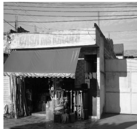
Figura 4: Loja de Rações.