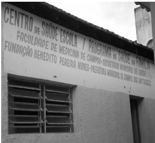
Figura 15: CSEC.

No campo da atuação comunitária, há registros do envolvimento da Associação de Moradores na busca de melhorias. Alguns dos antigos moradores, motivados pelos seus espíritos de liderança, ao reivindicarem a água, acabaram por se articular com instituições e políticos do município, o que gerou e tornou possível o atendimento de outras demandas, como a implantação de um Centro de Saúde Comunitário (CSU) em parceria com a Faculdade de Medicina de Campos, hoje identificado como CSEC (Centro de Saúde Escola de Custodópolis). Trata-se de uma unidade de Atenção Básica de Saúde, em parceria com a prefeitura local, que registra seus principais atendimentos nas áreas de “problemas cardíacos, dermatológicos, hanseníase, verminose, hipertensão, diabetes, depressão, crianças com baixo peso” (Ibid., p.58).