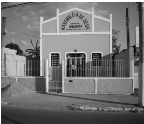
Figura 7: Igreja Assembléia de Deus.