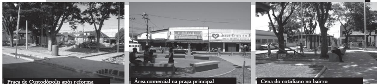
Praça de Custodópolis após reforma