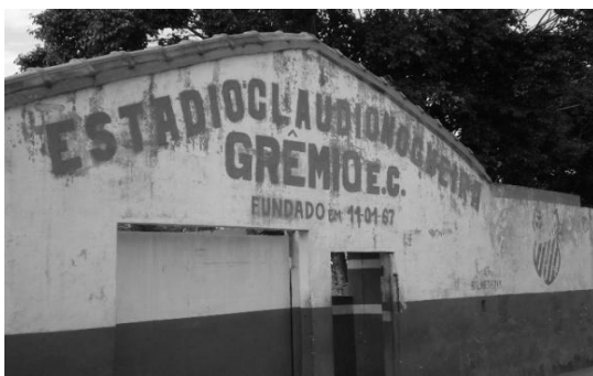
Figura 9: GRÊMIO ESPORTIVO.

O que não parece ter preço é o futebol. O time “Come Gato” tornou-se Grêmio em 1974. Legalizado, participa da Liga Campista de Desportos, promove regularmente jogos, e tem uma escolinha de futebol que atende às crianças do local, além de funcionar também como entidade filantrópica, “por prestar ajuda material e ceder seu espaço para festas, reuniões, velórios, campanhas de vacinação” (Ibid.,p. 47). O Grêmio é um dos principais locais de lazer e sociabilidade do bairro.