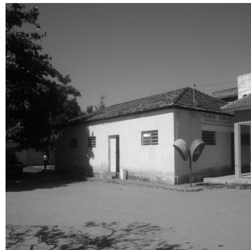
Figura 16: CSEC.