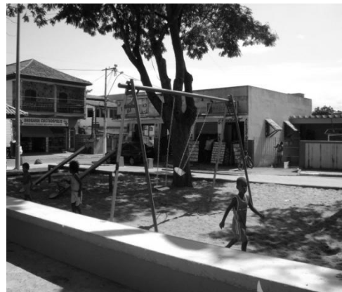
Figura 12: Praça José Dias Nogueira.