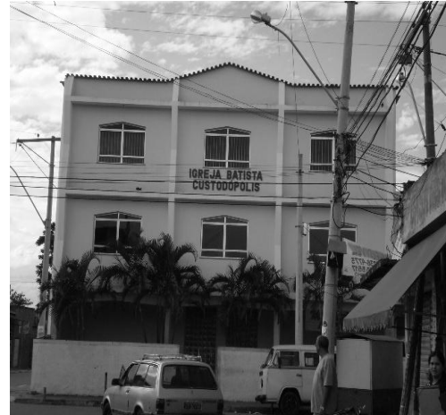
Figura 6: Igreja Batista.