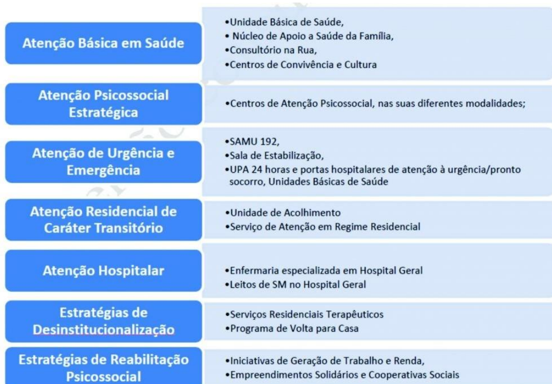
Figura 1 – Rede de Atenção Psicossocial: componentes e respectivos pontos de atenção