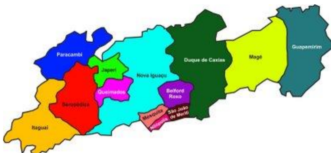
Figura 2 – Mapa da Baixada Fluminense (RJ)

No presente trabalho, adotamos a definição desse território baseada na fisiografia, haja vista que se trata do referencial utilizado pelo Poder Público para a compreensão econômica, social, política e cultural da Baixada Fluminense. Sendo assim, reconhecemos a região como sendo composta por 13 municípios, a saber: Nova Iguaçu, Duque de Caxias, São João de Meriti, Belford Roxo, Queimados, Mesquita, Japeri, Nilópolis, Magé, Guapimirim, Paracambi, Seropédica e Itaguaí 22 . A Figura 2 apresenta o mapa físico com os municípios que compõem a Baixada Fluminense.