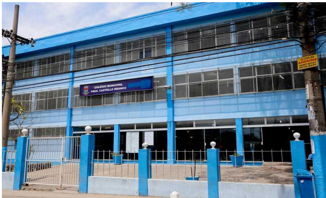
Figura 2 – Frente do Colégio Municipal Presidente Castello Branco